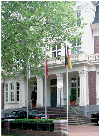
Baosteel-Europa-Headquarter in Hamburg.

Mit einem Produktionsvolumen von 21,41 Millionen Tonnen Stahl ist die staatlich kontrollierte Shanghai Baosteel Group Corporation Vorreiter auf dem chinesischen Stahlmarkt. Bei einem Umsatz von 161,76 Milliarden Yuan erwirtschaftete die Gruppe einen Nettogewinn von 12,72 Milliarden Yuan. Baosteel produziert die gesamte Bandbreite von Standard- und Spezialstählen – von der Cola-Dose über den Schiffsrumpf bis hin zur Pipeline. Zu den nationalen wie internationalen Kunden von Baosteel zählen vorwiegend die Automobil- und Bauindustrie sowie Haushaltsgerätehersteller.